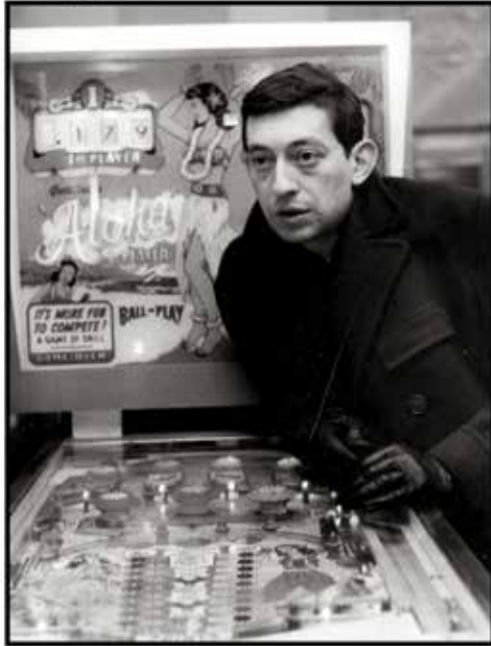
Serge Gainsbourg