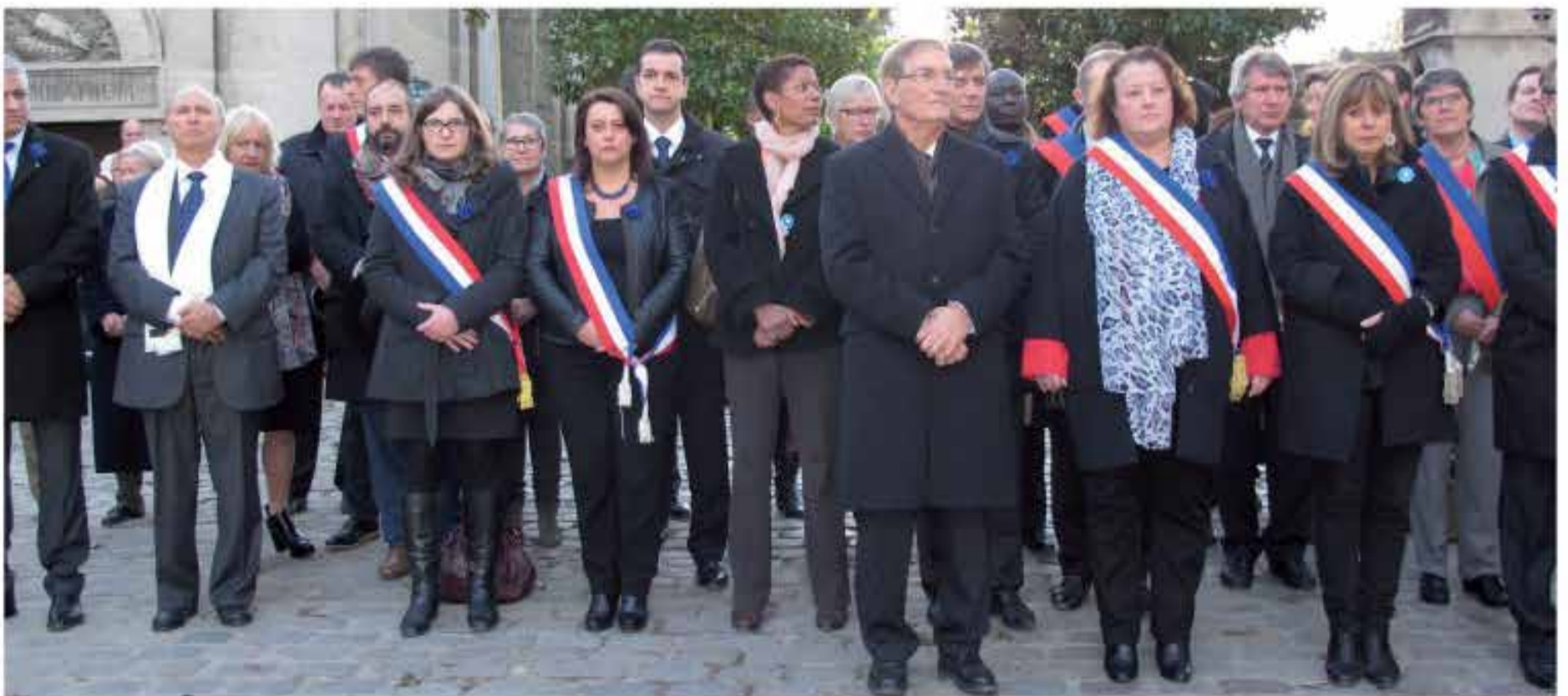
Rangée des personnalités : au centre Madame George Pau-Langevin, Ministre de l'Outre-mer.