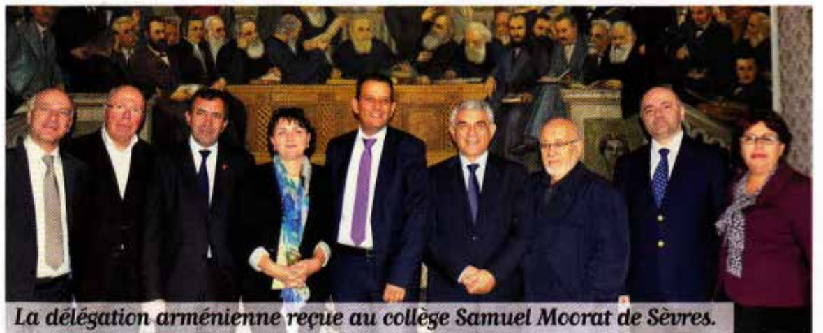
La délégation arménienne reçue au collège Samuel Moorat de Sèvres.

importante coopération décentralisée avec l'Arménie, comme les villes de Valence ou de Clamart ou encore les conseils généraux de la Drôme et des Hauts-de-Seine.