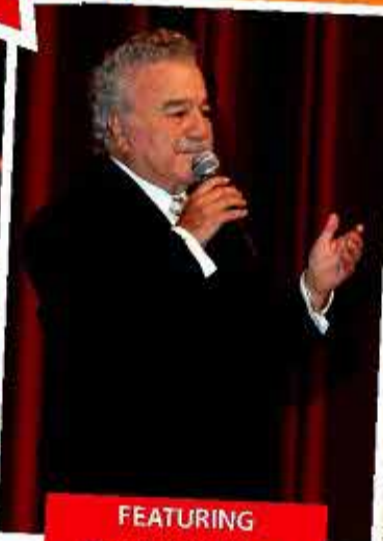
FEATURING Onnik Dinkjian