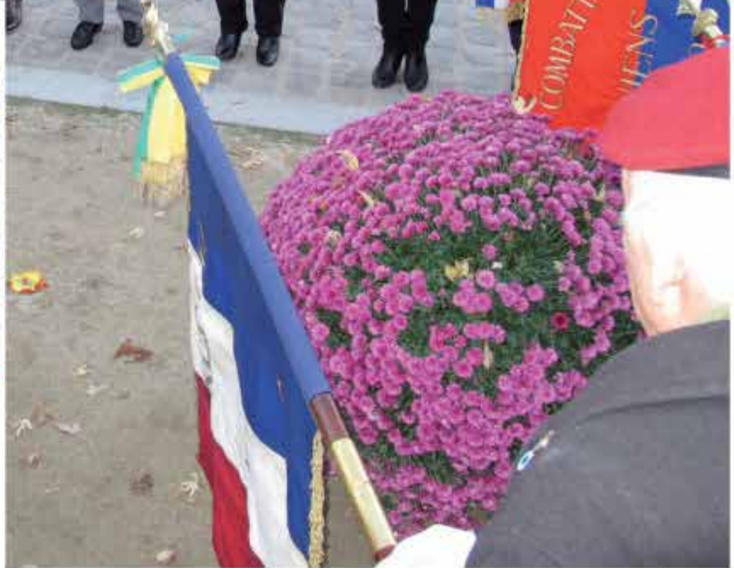
Le monument aux morts arméniens.