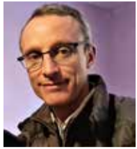
De notre envoyé spécial Antoine Bordier

Il est arrivé en septembre 2019 en Arménie, pour prendre la direction du lycée français Anatole France, qui se situe dans la capitale. Dans quelques jours, il s'installera dans son nouvel établissement. Portrait d'un passionné-visionnaire, qui aime autant le football que son métier.