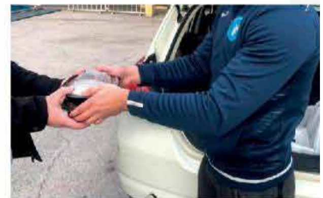
Nos étudiants distribuent des repas aux foyers dans le besoin.

Cela nous a donné une rare occasion de voir ce qui se passait à l'intérieur de nombreux foyers, souvent trop