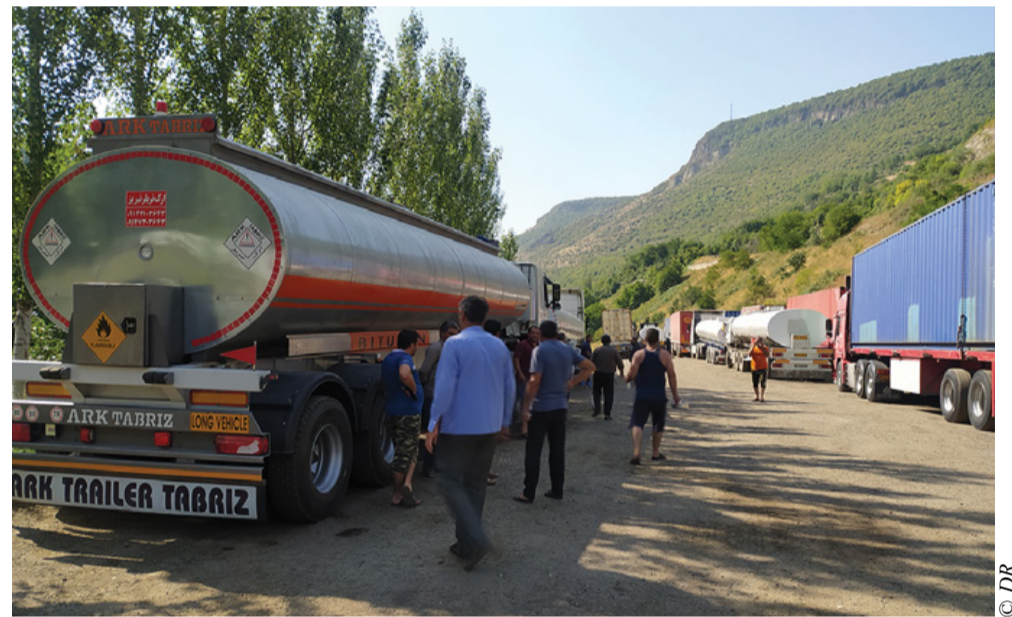
Camions iraniens bloqués aux abords de Vorotan

« Les chauffeurs iraniens nous ont informés que la police azérie les avait arrêtés et les avait informés qu'ils étaient entrés sur le territoire azerbaïdjanais », a déclaré Gorg Tosunyan, correspondant pour Civil-Net. « Les Azerbaïdjanais ont exigé 130 dollars à chaque conducteur. Après que les chauffeurs eurent déclaré qu'ils n'avaient pas d'argent, la