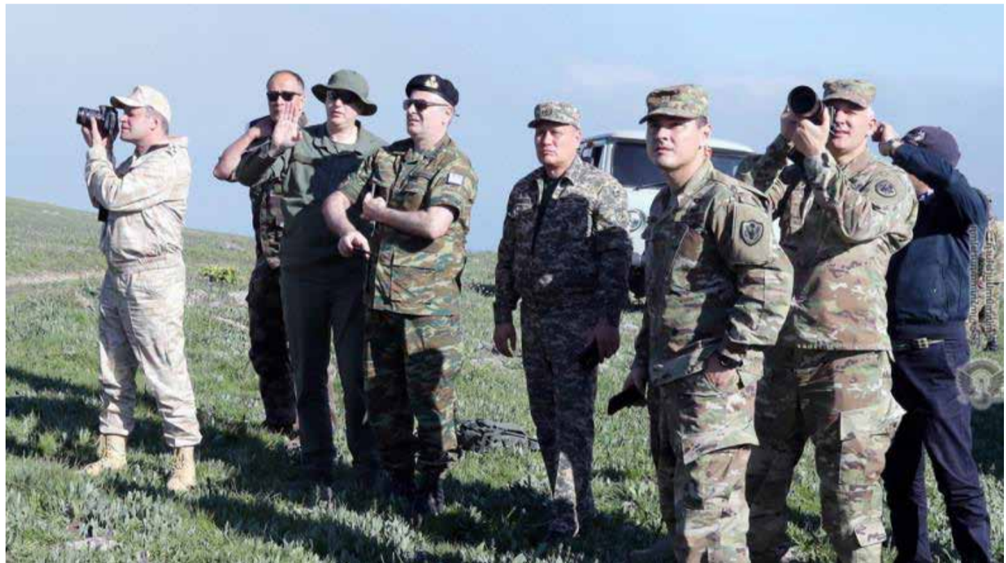
Attachés militaires des ambassades accréditées en Arménie dans la région de Syunik

Le ministère arménien de la Défense a organisé la visite des attachés militaires des ambassades accréditées en Arménie dans la région de Syunik le 20 mai pour se