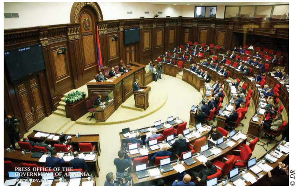
Le Parlement arménien

La constitution arménienne stipule que de telles élections ne peuvent avoir lieu que si le Premier ministre démissionne et que le Parlement échoue à deux reprises à élire un nouveau chef du gouvernement dans les