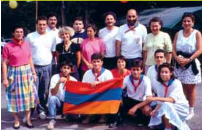
1990 - Première colonie en Arménie avec l'équipe d'Espoir pour l'Arménie