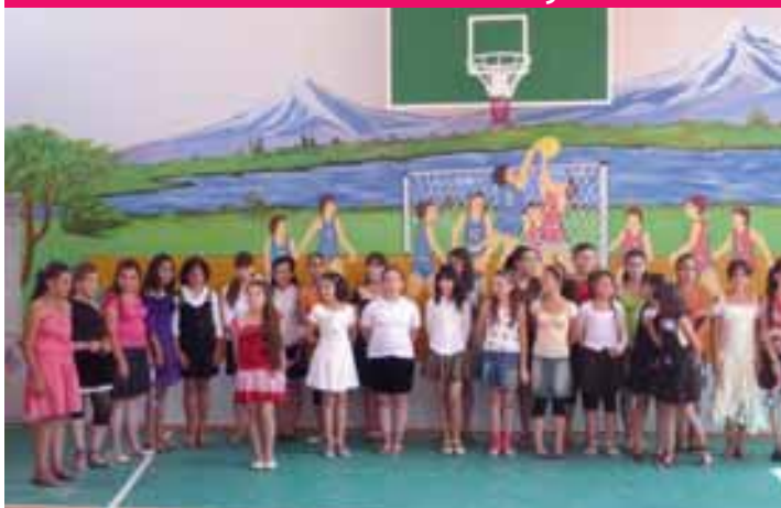
2011 - Gymnase de Spitak