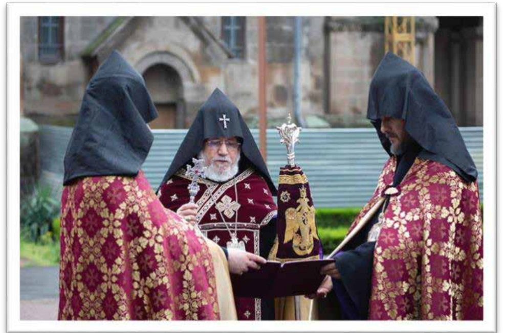
Sa Sainteté Karekin II