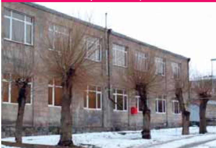
2018 - Centre Culturel de Sissian