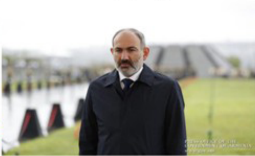
Վարչապետ Նիկոլ Փաշինեան իր տիկնոջ Աննա Յակոբեանի հետ, Ապրիլ 24-ին այցելեցին Ծիծեռնակաբերդ յարգանքի տուրք մատուցելու Հայոց Բեռնաստանութեան 105-րդ տարեփոխ արդ.