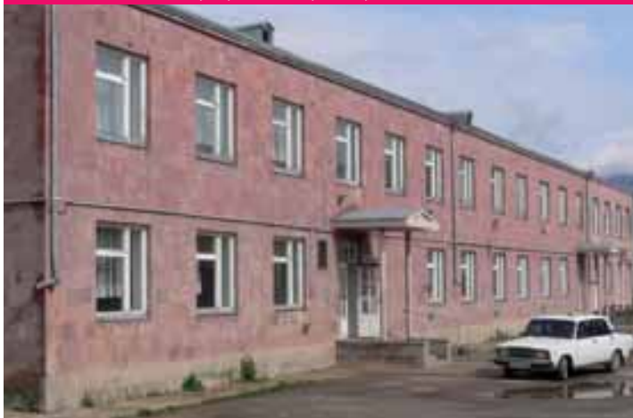
1999 - École Daniel Sahagian