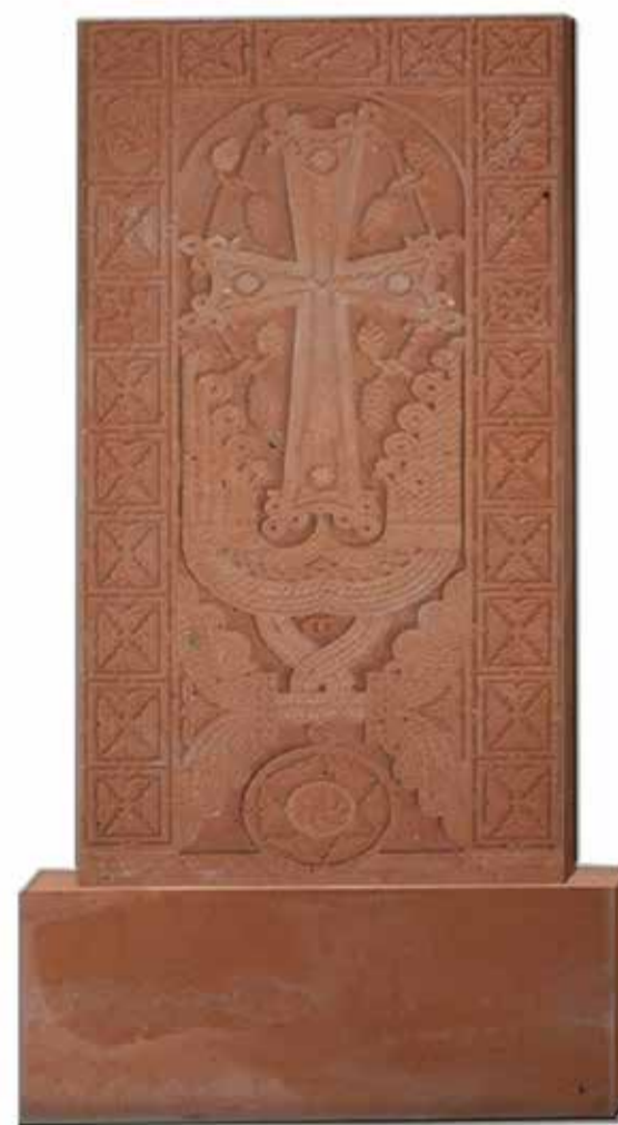
Khatchkar Pierre à Croix arménienne